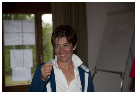
Damen Doppel: Pascale Sidler Angehrn/Gaby Schmalz (nicht auf Foto)